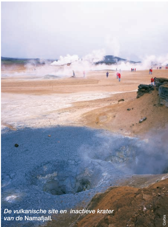
De vulkanische site en inactieve krater van de Namafjall.

Op zoek naar onderdak voor de nacht klop ik die avond aan bij een boer. Algauw lig ik met mijn slaapzak knus in het stro van zijn schuur, omringd door blatende schapen. In al zijn gastvrijheid laat de boer me de volgende dag getuige zijn van de geboorte van een lammetje. De keuze aan logies in IJsland is heel divers: landelijke gîtes, hutten, hotels ... De hoeves en herbergen vallen ook erg in de smaak bij toeristen, omdat ze een ideale combinatie zijn van natuur, avontuur en gastvrijheid. IJslanders zijn heel vriendelijk en geven uitvoerig tips. Als je graag vist bijvoorbeeld, zullen ze je vertellen waar je de beste rivieren kunt vinden voor forel of zalm. Langs het 37 km lange parcours rond het Myvatnmeer liggen talloze vulkanische sites. Veel toeristen doorkruisen de streek dan ook per fiets. Een eerste verplichte halte is Dimmuborgir , dat bezaaid is met 2000 jaar oude pilaren van vulkanisch gesteente. Sommige zijn meer dan 20 meter hoog. Op de andere oever van het meer beklimmen een paar dappere wandelaars de 529 meter